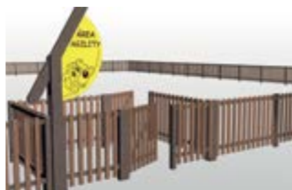
PÓRTICO SENCILLO DE ENTRADA ÁREA AGILITY