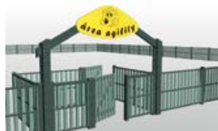
PÓRTICO DOBLE DE ENTRADA ÁREA AGILITY